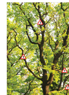
Totholz als Gefahrenquelle