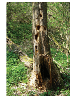
Totholz als Nahrungsquelle und Lebensraum

Durch die räumliche Konzentration von Totholz in Gruppen, wird das Gefahrenpotential auf diese „Totholz-Inseln“ konzentriert. Weitere Informationen zu diesem Thema finden Sie auf der Internetseite www.waldwissen.net