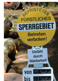
Absperrtafel lt. forstlicher Kennzeichnungsverordnung