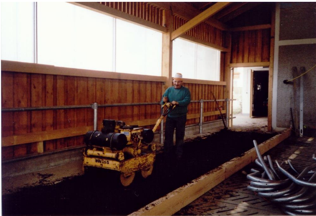
Wichtig: Bei der Neuanlage den Mist gut festwalzen!