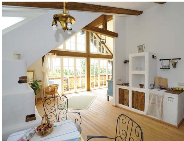
Bild 2: Für Einnahmen aus Privatzimmervermietung in Form von „Urlaub am Bauernhof“ steht ein eigener Freibetrag von € 3.700 zu.

Beiträge für Einnahmen aus Nebentätigkeiten sind am Ende des Kalendermonats fällig, in dem die Vorschreibung erfolgt. Die Vorschreibung erfolgt als Einmalbetrag spätestens mit der dritten Quartalsvorschreibung in dem Jahr, das dem jeweiligen Beitragsjahr folgt. Die Beitragsgrundlage aus Nebentätigkeiten wird grundsätzlich zur Beitragsgrundlage aus dem Urproduktionsbetrieb („Flächenbetrieb“) hinzugerechnet. Die Beitragszahlungen sind insgesamt durch die monatliche Höchstbeitragsgrundlage von € 5.985,- (Wert 2018) begrenzt.