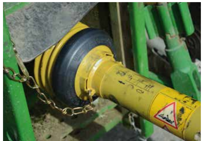
Abbildung 27: Gelenkwellen können bei unsachgemäßer Handhabung eine große Gefahrenquelle darstellen.

Gelenkwellen: Gelenkwellen sind eine häufige Art des Antriebs für Maschinen, die an landwirtschaftliche Fahrzeuge angebaut sind. Diese drehen sich im Einsatz mit mindestens 540 Umdrehungen pro Minute (neun Umdrehungen pro Sekunde) um die eigene Achse. Es ist daher auf einen vollständigen Schutz zu achten. Dieser besteht aus einem Schutzschild beim Traktor, einem Gelenkwellenschutz und einem Schutztopf am Gerät. Der Gelenkwellenschutz ist zusätzlich mit Halteketten ausgestattet, die einzuhängen sind, um das Mitdrehen des Gelenkwellenschutzes zu verhindern. Sicherheitsbestimmungen an Maschinen müssen der Maschinensicherheitsverordnung (MSV) entsprechen. Weitere Sicherheitsbestimmungen finden sich in harmonisierten europäischen Normen (EN) und österreichischen Normen (ÖNORM).