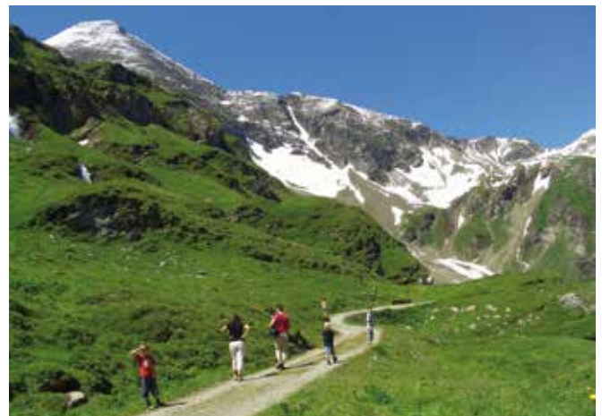
Abbildung 9: Die Wegfreiheit im Wald und auf Ödland kann unter bestimmten Umständen eingeschränkt werden.

Zuständige Behörde in diesen Angelegenheiten sind die Agrarbehörden der Länder. Gegen deren Bescheide bzw. bei allfälliger Untätigkeit ist eine Beschwerde an das jeweils zuständige Landesverwaltungsgericht möglich.