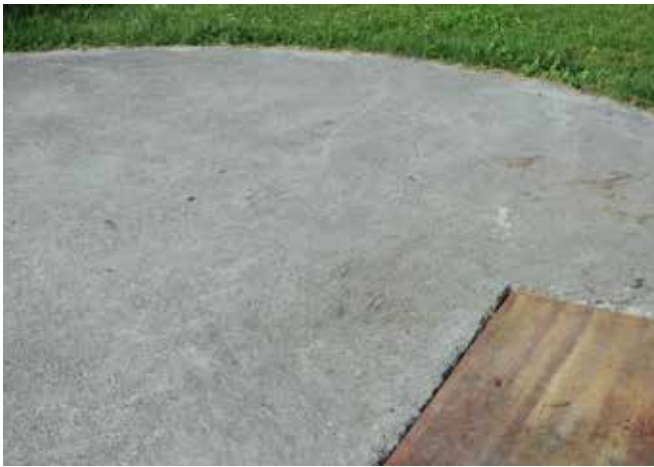
Abbildung 21: Deckel geschlossener Güllegruben müssen eine entsprechende Tragkraft aufweisen.