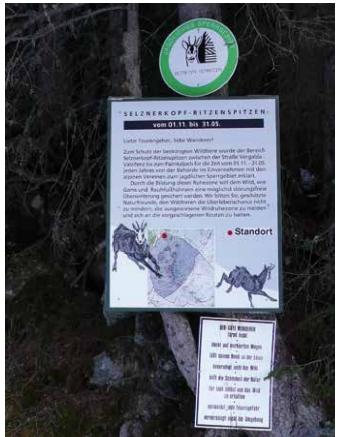
Abbildung 11: Sperrgebiete können die Wegfreiheit einschränken.

Zu den möglichen jagdlichen Sperrgebieten in den einzelnen Bundesländern zählen beispielsweise