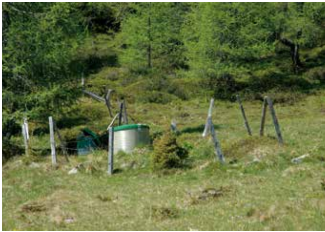
Abbildung 6: Ausgezäunte Quellfassung