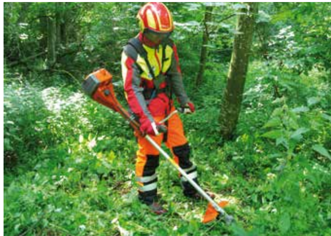
Abbildung 25: Beim Einsatz von Freischneidern ist auf eine entsprechende Schutzausrüstung zu achten.