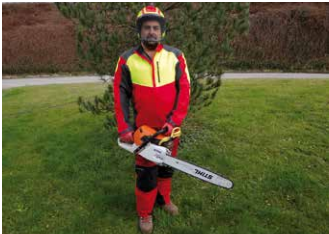
Abbildung 24: Eine persönliche Schutzausrüstung für Arbeiten im Wald ist unerlässlich.