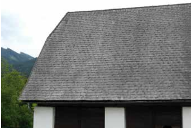
Abbildung 28 Bei alten Stalldächern wurden häufig Dachschindeln aus Asbestzement verwendet.