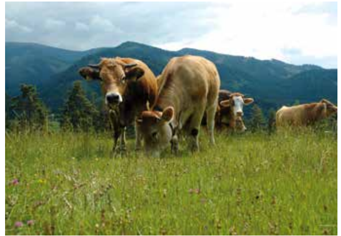
Abbildung 15: Galtvieh wird oft den Sommer über auf die Alm getrieben.

Beschreibung des Almbetriebs: Die in Kärnten gelegene, voll erschlossene Hochalm hat eine Gesamtfläche von 872 ha, davon 490 ha Almfutterfläche, und wird als Galtviehalm genutzt. Die Auftriebszeit dauert durchschnittlich vom 10. Juni bis zum 15. September. Die Alm ist im Besitz einer Agrargemeinschaft mit 23 Mitgliedern. Im Jahr 2009 wurden gemäß INVEKOS-Daten insgesamt 304 Tiere (248 GVE), davon 13 Pferde, 140 Rinder zwischen 0,5 und zwei Jahren sowie 151 Rinder über zwei Jahren, aufgetrieben. 102 Tiere stammen von 13 Auftreibern, die nicht zur Agrargemeinschaft gehören. Für diese Tiere wurde 2009 ein Weidezins von 40 Euro pro Tier eingehoben. Die Alm wird von zwei Hirten betreut. Die Mitglieder der Agrargemeinschaft sind zum Ableisten von Arbeitsschichten je nach Anzahl ihrer Anteile verpflichtet. Jeder Anteil entspricht einer Schicht von sechs Arbeitsstunden. Die Almeinrichtungen umfassen vier Almhütten und drei Almställe, die in den Jahren 2002–2008 unter Inanspruchnahme von Investitionsförderung saniert wurden. Die insgesamt sieben Koppeln der Alm werden mit Stacheldraht auf einer Länge von rund 10 km eingezäunt. Die Wasserversorgung auf der Alm ist unproblematisch, da durch jede Koppel ein Bach fließt.