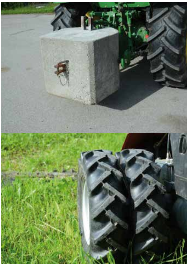
Abbildung 26: Ballastgewicht und Zwillingsbereifung reduzieren die Kippgefahr. (© Susanne Schönhart)

Die Fahreigenschaften werden durch Anbaugeräte wesentlich beeinflusst. Speziell der Frontlader kann den Schwerpunkt verlagern und somit die Kippgefahr erhöhen. Besondere Gefahrensituationen für das Umkippen des Fahrzeugs sind der Fahrtrichtungswechsel im steilen Gelände und die Verlagerung des Schwerpunkts der Ladung am Hang. In den meisten Fällen wird durch den Überschlageschutz ein Weiterrollen verhindert. Die größte Überlebenschance besteht daher, wenn sich die Lenkerin oder der Lenker beim Sturz in der Kabine festhalten kann.