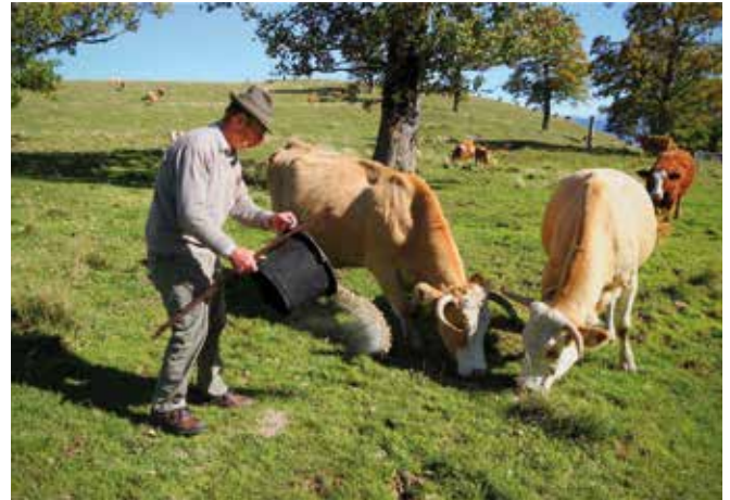
Abbildung 1: Betriebsleiter und mittätige Angehörige auf Almen unterliegen den Bestimmungen der Bauernsozialversicherung.

Alle in Österreich in der Land- und Forstwirtschaft selbstständig Erwerbstätigen einschließlich ihrer mittätigen Angehörigen und sonstigen mitversicherten Personen unterliegen in Fragen der Kranken-, Unfall- und Pensionsversicherung den Bestimmungen des Bauern-Sozialversicherungsgesetzes (BSVG). Ist ein Betriebsführer auf der eigenen Alm z. B. als Senner tätig, so erfolgt dies im Rahmen seiner selbstständigen landwirtschaftlichen Tätigkeit.