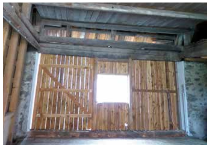
Abbildung 17: Bei erhöht liegenden Arbeitsplätzen ist es wichtig, dass die Bodenbeläge entsprechend dimensioniert sind.

Viele landwirtschaftliche Wirtschaftsgebäude sind in Holzbauweise errichtet. Bei den Bodenbelägen ist großes Augenmerk auf eine entsprechende Statik zu richten, sodass die Böden den Belastungen auch standhalten können. Insbesondere trifft dies auf die Bodenbeläge von Hochtennen zu, die meist die höchstgelegenen Etagen in Wirtschaftsgebäuden sind. Es kommt immer wieder vor, dass Personen aufgrund zu schwach dimensionierter Bodenbeläge durchbrechen und abstürzen.