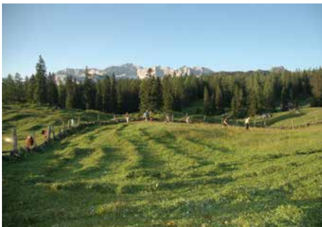
Abbildung 14: Almanger werden jährlich gemäht, um Notheu für die Tiere bereitstellen zu können.