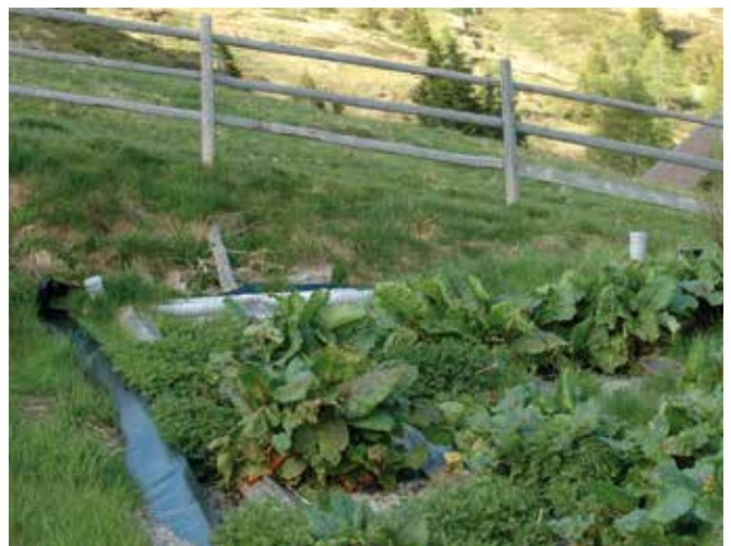
Abbildung 8: Pflanzenkläranlage auf der Alm