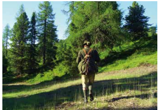
Abbildung 3: Jagdpachterlöse und Einkünfte aus Wildabschüssen sind im Rahmen der pauschalen Gewinnermittlung gesondert anzusetzen.

Ebenfalls nicht durch den land- und forstwirtschaftlichen oder almwirtschaftlichen Grundbetrag erfasst sind Jagdpachterlöse, die für die Bereitstellung von Grundflächen einer Eigen- oder Gemeindejagd gezahlt werden. Diese sind im Rahmen der pauschalen Gewinnermittlung als „Pachtzins“ gesondert anzusetzen. Die Einkünfte aus den Wildabschüssen (Einnahmen abzüglich der tatsächlich angefallenen Ausgaben für den vergebenen Abschuss wie z. B. anteilige Wildfütterungskosten, anteilige Kosten für die Errichtung von Hochsitzen und Kanzeln) sind ebenfalls gesondert anzusetzen. Auch hier bestehen keine Bedenken, die anteiligen Ausgaben mit 30 % der Einnahmen aus dem Wildabschuss zu schätzen und die Einkünfte aus den Wildabschüssen mit 70 % der Einnahmen anzusetzen.