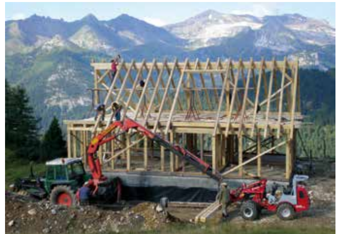
Abbildung 13: Bauvorhaben auf Almen unterliegen verschiedensten Auflagen.

Besteht eine für ein Bauvorhaben passende Widmung, ist ein Bauvorhaben auf die Übereinstimmung mit dem jeweiligen Baugesetz bzw. der Bauordnung zu überprüfen. Im Wesentlichen ist es Aufgabe des Planers, dafür zu sorgen, dass ein Bauvorhaben den Bestimmungen des Baugesetzes bzw. der jeweiligen Bauordnung entspricht. Zu beachten sind dabei vor allem die technischen Bauvorschriften.