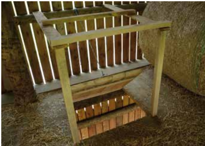
Abbildung 18: Abwurfkufen sind mit Absturzsicherungen zu versehen.