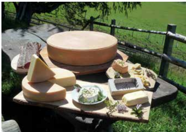
Abbildung 2: Selbst erzeugte Produkte dürfen im Rahmen der Ausnahmeregelung des Almausschanks an Gäste verabreicht werden.

Die im Rahmen der Almbewirtschaftung verabreichten Produkte müssen nicht auf der Alm erzeugt oder zubereitet werden. Das bedeutet, dass die Produkte durchaus am landwirtschaftlichen (Haupt-)Betrieb bzw. im Rahmen der Lohnverarbeitung hergestellt werden können, um sie dann auf der Alm anzubieten.