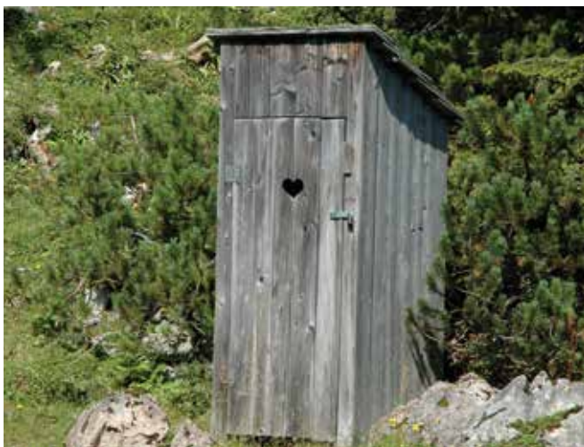
Abbildung 7: Plumpsklo – eine Form der Trockentoilette

Eine Kläranlage kann als Pflanzenkläranlage oder als technisch-biologische Anlage ausgeführt werden und ist wasserrechtlich zu bewilligen. Beide Systeme haben sich in der Praxis auf Almen bewährt. In der Anschaffung sind sie teurer als Senkgruben oder Trockentoiletten, jedoch besteht die Möglichkeit, Bundes- und Landesförderungen dafür in Anspruch zu nehmen.