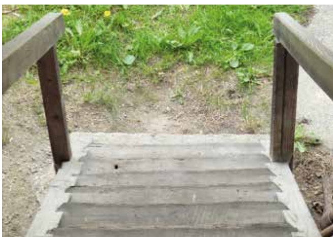
Abbildung 19: Stiegen sind Leitern vorzuziehen.

Stiegen sollten gegenüber Leitern bevorzugt werden, weil darauf ein sichereres Gehen als auf Leitern möglich ist.