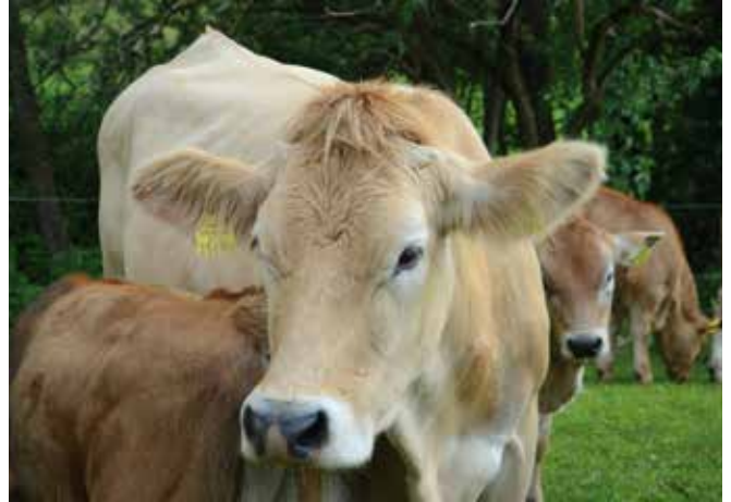
Abbildung 22: Fachgerecht enthornte Rinder reduzieren das Verletzungsrisiko bei der täglichen Tierbetreuung.

Unfälle bei der Tierhaltung stehen in der Unfallstatistik an vorderster Stelle. Speziell der Umgang mit Rindern zählt zu den gefährlichsten Tätigkeiten in der Landwirtschaft. Voraussetzungen für eine sichere Tierhaltung sind ein verständnisvoller, ruhiger und vorausschauender Umgang mit den Tieren, artgerechte Haltungsformen, arbeitssparende Mechanisierung für Fütterung, Entmistung und Milchgewinnung, befahrbare Verkehrswege, die einen Einsatz von Sackrodel und Schubkarren ermöglichen, rutschhemmende Böden, die Verhinderung von Stolperstellen, ausreichende Beleuchtung und eine fachgerechte Enthornung.