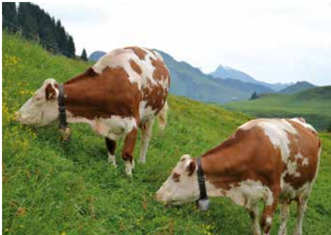
Abbildung 16: Milchkühalmen sind oft an ertragreicheren Standorten zu finden.

Beschreibung des Almbetriebs: Die in Vorarlberg gelegene Testalm V2 ist 328 ha groß, davon sind 161 ha Almfutterfläche. Die 162,5 Weiderechte der Alm sind auf 16 Besitzer aufgeteilt. Auf die gemischte, voll erschlossene Alm werden insgesamt 141 GVE (davon 101 Milchkühe, der Rest Jungvieh) aufgetrieben. Die auf der Alm gewonnene Milch wird in der Gemeinschaftssennerei zu rund 11.700 kg Alpkäse und 1.000 kg Alpbutter verarbeitet. Zwei Drittel des Alpkäses wird an den Großhandel verkauft, ein Drittel wird im Sommer auf der Alm und im Winter von den Almbewirtschaftern direkt vermarktet. Die Einnahmen aus dem Verkauf der Almprodukte an den Großhandel werden in Form von „Milchgeld“ an die 16 Besitzer ausbezahlt. Die Erlöse sowie auch die Aufwendungen der Direktvermarktung verbleiben beim jeweiligen Heimbetrieb. Die Tiere werden von zwei Hirten betreut. Pro aufgetriebene Milchkuh müssen sechs unbezahlte „Fronstunden“ geleistet werden.