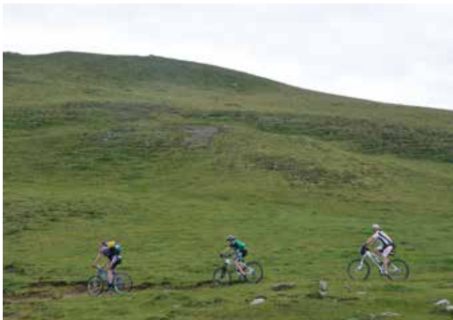
Abbildung 10: Mountainbiken ist nur auf ausgewiesenen Strecken erlaubt.

Durch den Vertragsabschluss zwischen einem Grundeigentümer und dem Vertragspartner wird etwa die Wegehalterhaftung zum Zweck des Radfahrens vom Grundeigentümer auf den Vertragspartner übertragen. Wichtig ist auch, dass der Vertragspartner eine zusätzliche Versicherung ohne Subsidiaritätsklausel abschließt. Insbesondere sollte der Vertragspartner auch verpflichtet werden, die freigegebenen Strecken regelmäßig auf Gefahren zu kontrollieren und für eine entsprechende Sauberkeit entlang dieser Strecken zu sorgen. Ein solcher Vertrag kann auch jahreszeitliche bzw. tageszeitliche Benützungzeiten regeln. Dem Grundeigentümer sollte es außerdem möglich sein, die Wegstrecke aus betrieblichen Gründen (z. B. Holzerntearbeiten, Jagd) sperren zu können.