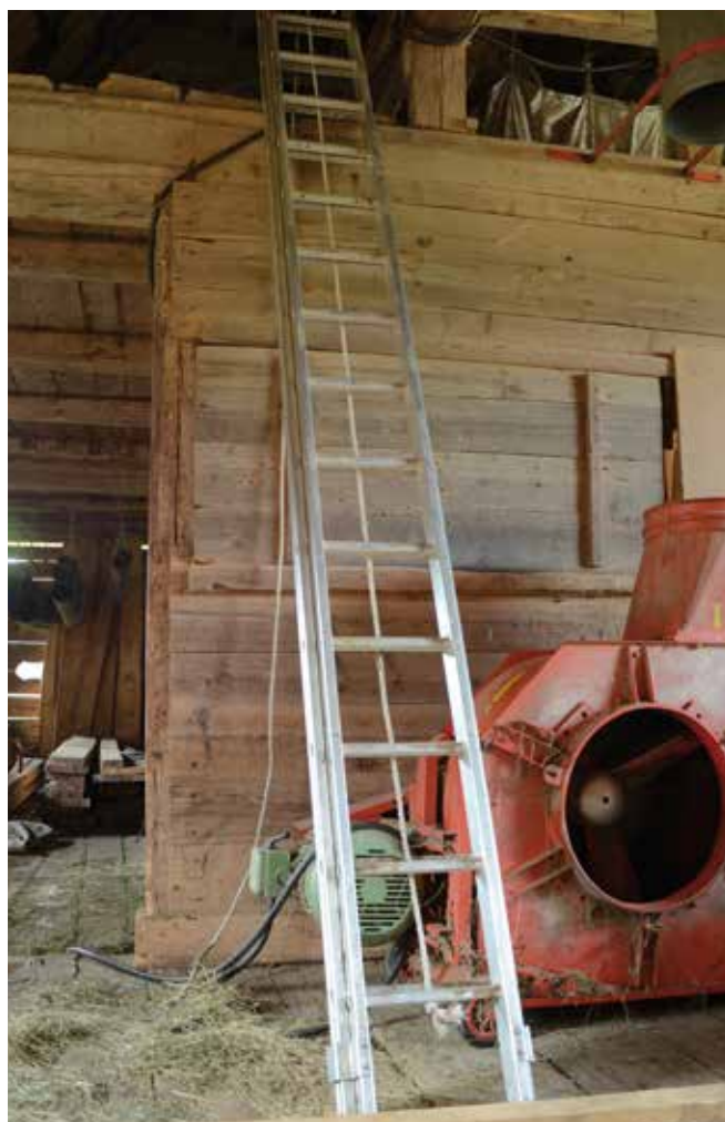
Abbildung 20: Leitern müssen wegrutschsicher aufgestellt werden.