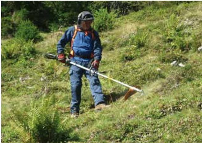
Abbildung 4: Unter Schwenden versteht man das Entfernen von unerwünschtem Bewuchs.

defläche im Almkataster oder als Lärchenwiesen, Hut- oder Dauerweide geführt werden, dort als Futterfläche ausgewiesen und schwer zugänglich sind.