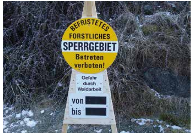
Abbildung 23: Das Absperrn des Arbeitsbereichs bei Fällungsarbeiten ist eine wichtige Schutzmaßnahme.