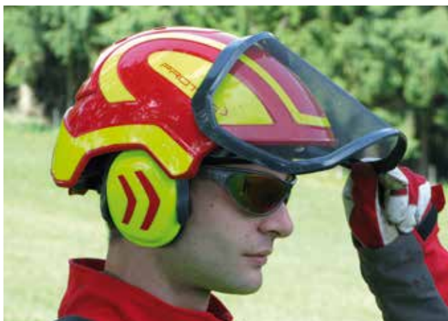
Abbildung 29: Auf Sonnenbrillen bzw. Schutzbrillen soll bei Arbeiten im Freien nicht vergessen werden.