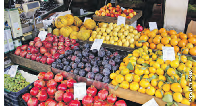
Farbenfrohe Früchte zählen zu den griechischen Exportschlagnern.

Dazu setzen sich ab sofort 13 engagierte, motivierte und bestens ausgebildete Seminarbäuerinnen mehr als Botschafterinnen für die Qualität und den Wert heimischer Lebensmittel ein. Insgesamt gibt es damit in Niederösterreich mittlerweile 184 Seminarbäuerinnen. In 154 Unterrichtseinheiten werden die nötigen persönlichen, fachlichen und organisatorischen Kompetenzen vermittelt.