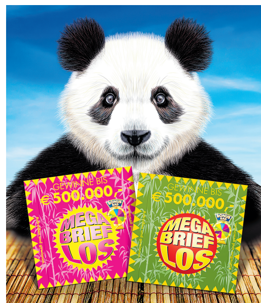
„Panda“ – mit 500.000 Euro Hauptgewinn – gibt es in allen Annahmestellen.

Wer kennt ihn nicht, den animalischen Scherz: „Welches Tier hat vom Farbfernsehen nicht profitiert? – Der Pandabär.“ Das tat und tut seiner Liebesswürdigkeit jedoch keinen Abbruch. Ganz im Gegenteil. Der schwarz-weiße, putzige Geselle aus China hat es sogar zum Wappentier des World Wide Fund For Nature (WWF) geschafft und steht da als Symbol für den Schutz unserer Erde. Aktueller denn je, und so widmen sich auch die Österreichischen Lotterien diesem Thema und bringen das neue Mega Brieflos „Panda“ auf den Markt. Der Pandabär zielt die Vorderseite des neuen Mega Briefloses, bei dem der Hauptgewinn – wie auch bei allen bisherigen Mega Brieflosen – wiederum 500.000 Euro beträgt. Daneben gibt es zahlreiche weitere Gewinne von drei bis 1.000 Euro, und das alles bei einem Lospreis von drei Euro. Die Lotterie besteht aus 2,5 Millionen Losen – und es gibt vier unterschiedliche Farbvarianten: grün, pink, gelb und blau. Zudem bietet auch das „Panda“-Los mit dem „Bonusrad“ eine zweite Gewinnstufe, bei der man in jeder Annahmestelle die Chance auf einen Sofortgewinn von bis zu 100 Euro hat.