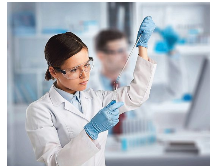
Die EU plant Gentechnik-Anschlag auf unsere Biobauern

Was ihn erzürnt: „Die Konsumenten zahlen bewusst mehr für nachhaltig erzeugte Lebensmittel und haben dann trotzdem Gentechnik auf dem Teller.“ Mit Fairness habe das nicht das Geringste zu tun. Das sei nichts anderes als ein neuer Kniefall vor den milliardenschweren Agrokonzernen – auf Kosten der „sauberen“ heimischen Landwirtschaft und auch ihrer Kunden. Sidl ruft im Lichte laufender Verhandlungen (als nächstes am 7. November) alle Parlamentarier in Brüssel zum Widerstand auf. M. Perry