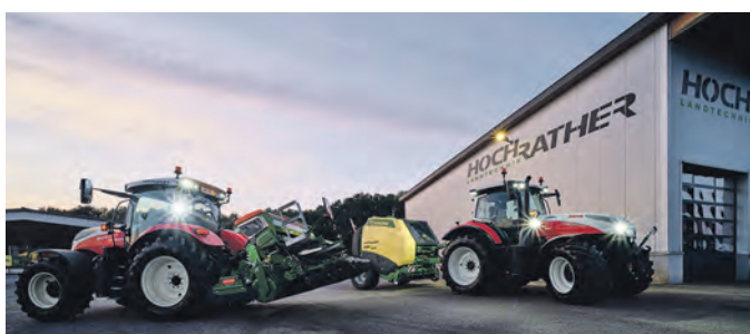
Eine gemütliche Atmosphäre wartet auf die Besucher.

Von 3. bis 4. November findet jeweils von 9 bis 17 Uhr die Hausmesse am Firmengelände in Aschbach Markt statt. Bei jeder Witterung verbringen Besucher einen gemütlichen Tag bei Hochrath Landtechnik. Jeden Gast erwartet ein Frei-