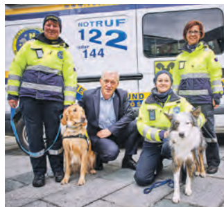
Jetzt freiwillig engagieren.

Wie man sich freiwillig engagieren kann, erfahren Besucherinnen und Besucher bei der Niederösterreichischen Freiwilligenmesse am 12. November 2023 von 10 bis 17 Uhr im Landhaus St. Pölten. 50 Vereine und Organisationen präsentieren das breite Spektrum des Ehrenamts, von Kultur über Soziales und Jugend- und Seniorenbetreuung bis hin zur Arbeit in Blaulichtorganisationen oder Zivilschutz. „Die Freiwilligenmesse gibt einen guten Überblick, wie und wo man sich freiwillig einbringen kann. Mit unserer Plattform Service Freiwillige und der Freiwilligen-