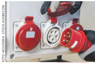
Spezieller Tarif für Landwirte

Die LK Niederösterreich hat im Juni des vergangenen Jahres mit der EVN für ihre Kammermitglieder einen gesonderten Tarif vereinbart. Dieser wurde für das 2. Quartal 2024 wie folgt angepasst: Der Landwirtschaftstarif der EVN „Mega Smart Float Natur“ von 1. April bis 30. Juni beträgt ohne Umsatzsteuer zur Hauptzeit (HZ, werktags 8 bis 20 Uhr) 11,2381 Cent/kWh und zur Nebenzeit (NZ) 10,7244 Cent/kWh. Im 1. Quartal waren es zur HZ 22,65 Cent und zur NZ 17,47 Cent. Bei Verträgen, die bis zum 30. September 2023 abgeschlossen wurden, werden 10 Prozent Rabatt gewährt, bei Vertragsabschluss ab