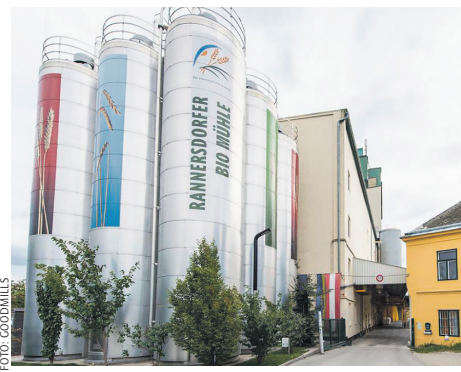
GoodMills baut demnächst noch eine Bio-Mühle.