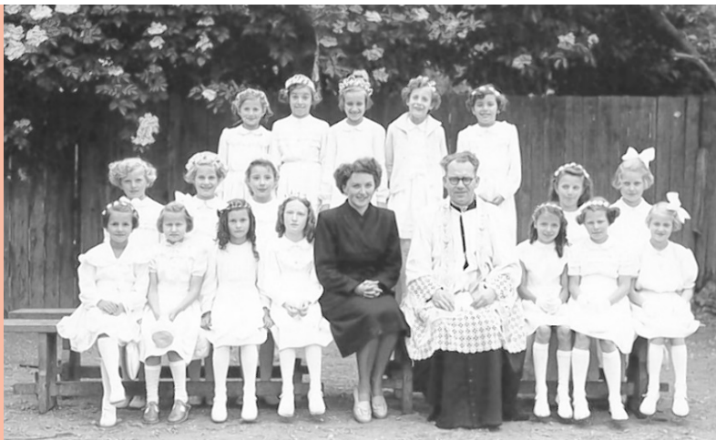
◀ Dieses Foto wurde 1953 in Tulln aufgenommen. Es zeigt die Erstkommunion der Mädchen des Jahrgangs 1944.

Auch während des Zweiten Weltkriegs war die Erstkommunion in Österreich ein bedeutendes religiöses Ereignis. Nach dem Krieg wurden die von den Nationalsozialisten zerschlagenen kirchlichen Organisationen in Österreich wieder aufgebaut. Die Beziehung zwischen der katholischen Kirche und dem österreichischen Staat verbesserte sich ebenfalls.