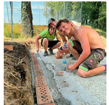
Schotter wurde herbeigeschafft, Pfeiler montiert, Wände gebaut etc.