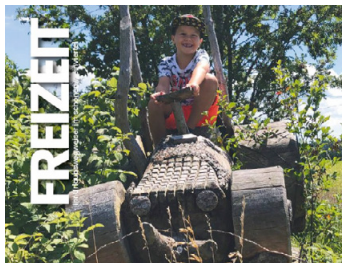
Mit Ihrem Foto „Wellness & Erholung“ gewinnen.

NÖ. Sie haben es sicher schon durchgeblättert, unser „Freizeitjournal“. Darin geben wir jedes Jahr viele Tipps für die besten Ausflugsziele in Ihrem Viertel: von ausgefallenen Freizeitaktivitäten über kulinarische Genüsse bis hin zu sportlichem Auspowern oder auch gemütlichem Entspannen.