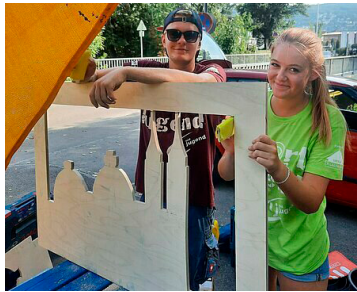
Ein nützliches Insektenhotel mit stylischer Stiftsilhouette entstand.