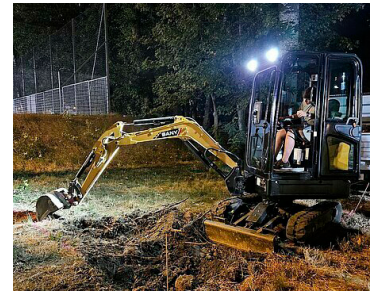
Freitagnacht wurde noch lang gebaggert und gemalt.