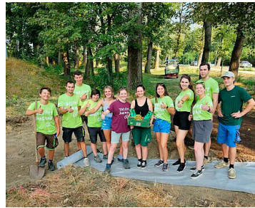
Motiviert wurde das Projekt angegangen.

KLOSTERNEUBURG. Unter dem Motto „Die Landjugend gestaltet um“ nahmen die Klosterneuburger auch heuer wieder beim Projektmarathon der Landjugend Niederösterreich teil. In 42 Stunden galt es, ein Projekt für die Stadtgemeinde zu verwirklichen: den Begleitweges entlang des Auparkes attraktivieren und ein Leitsystem mit Informationstafeln zu den einzelnen Angeboten entwickeln. Alle packten an, arbeiteten zusammen und konnten Sonntagabend sowohl einen spannenden Wissensweg, Fahrradwerkstatt, Hundetränke, Erholungsplatz mit gemütlicher Sitzrunde, Barfußweg, Hängematten u.v.a.m. präsentieren.