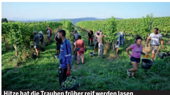
Hitze hat die Trauben früher reif werden lassen.