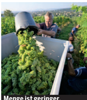
Menge ist geringer.