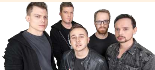
Die fünf Vollblutmusiker feiern als Cover-Band.