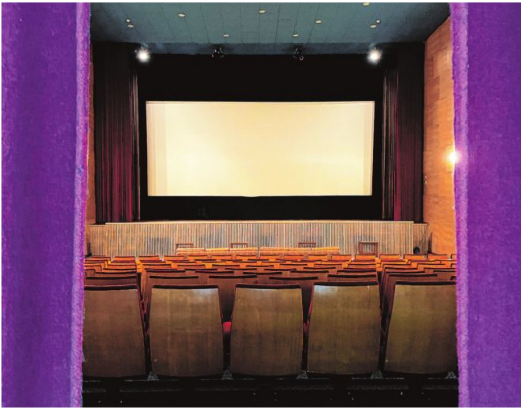
„Alles steht kopf 2“ (o.) und „Deadpool & Wolverine“ lockten die Tiroler in die Filmsäle, u. a. im wiederöffneten Kino in Mayrhofen.