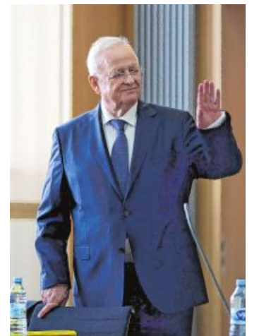
Ex-VW-Chef Martin Winterkorn gab sich gelassen.

Im September 2015 hatten US-Umweltbehörden und Wissenschaftler die Abgasmanipulationen entdeckt. Nach Überzeugung der Staatsanwaltschaft wusste Winterkorn deutlich früher über Abgasmanipulation Bescheid, als er bisher angegeben hat. Spätestens seit Mai 2014 sei er über den Einsatz einer illegalen Software in den USA informiert gewesen, hieß es in der ersten Anklageschrift. (dpa)