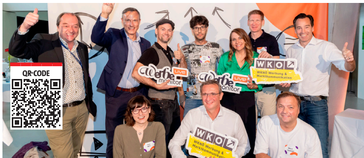
Werbemonitor LIVE, das bedeutet Inspiration, Know-how und Best-Practice-Erfahrungen sowie Networking und Austausch.