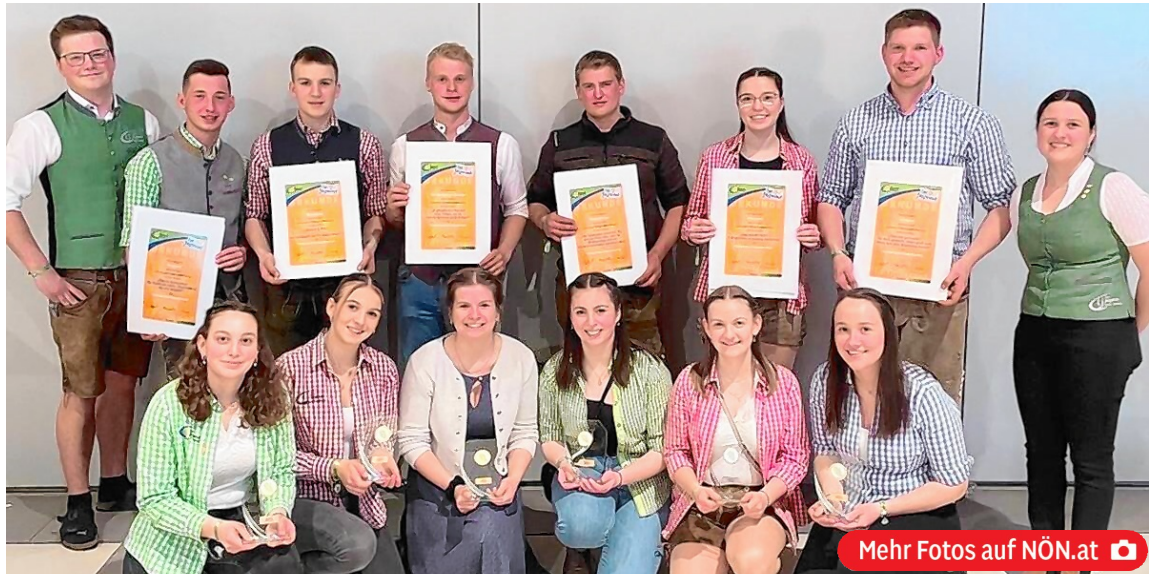
Mehr Fotos auf NÖN.at

Nach dem offiziellen Teil wurde ordentlich gefeiert. Bis zwei Uhr nachts amüsierten