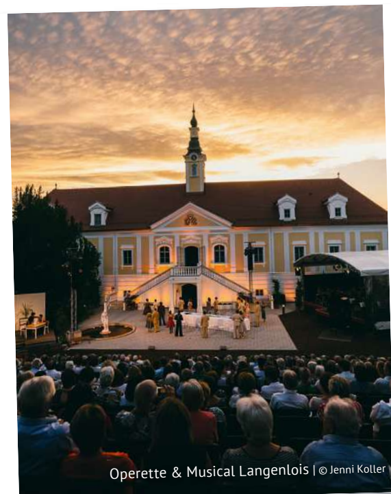
Operette & Musical Langenlois