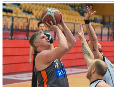
Sitting Bulls: Knappe Niederlage im Finale.

Der Sager von Nationalrat Johannes Schmuckenschlager (siehe Artikel rechts) klingt nicht nur gut, sondern thematisiert ein ernstes Problem, das die Gesellschaft entzweit: Negative Postings erzeugen in den Sozialen Medien mehr Interesse. Schimpfen generiert mehr Klicks und damit höhere Werbeeinnahmen für die Plattformbetreiber und Content-Kreatoren. Die Wahrheit spielt da oft nur eine Nebenrolle. Die Konsumenten von Sozialen Medien können sich nicht sicher sein, ob hinter den Beiträgen ein echter Mensch oder bloß ein Bot steckt. Und: Es bleibt unbekannt, ob der Verfasser beim Verfassen nicht zu tief ins Glas geschaut hat.