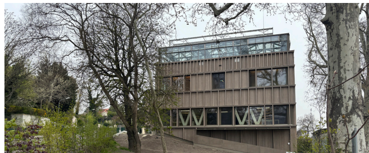
Das „Zentrum für Wein- und Obstbau“ hat eine Gesamtnutzfläche von 4.215 Quadratmeter und am Dach ein großes Gewächshaus.

der Kirchenbesucher und meinte sinngemäß: Wenn die Zahl der Kirchgänger steigt, dann wächst auch die Zahl der Weintrinker wieder. Eder selbst erhielt anlässlich seines 40. Dienstjubiläums eine Urkunde überreicht.