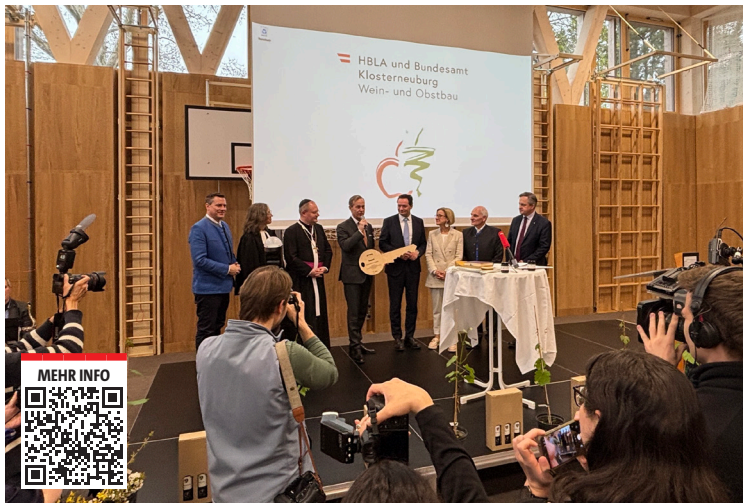
Der neue Turnsaal war bei der Eröffnung voll und das Interesse der Medien war groß.