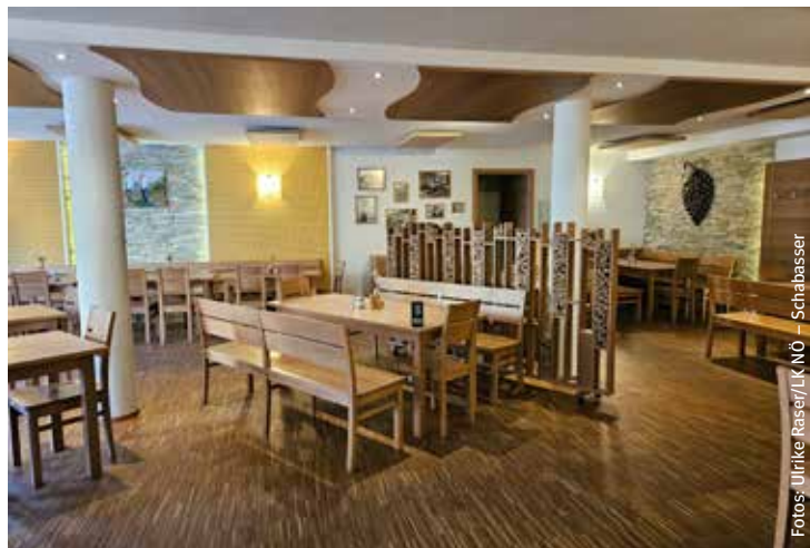
Der einladende Gastraum verspricht ein paar gesellige Stunden.