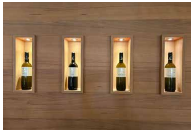
Beim Heurigen Schabasser präsentiert sich der Wein in ansprechender Weise.