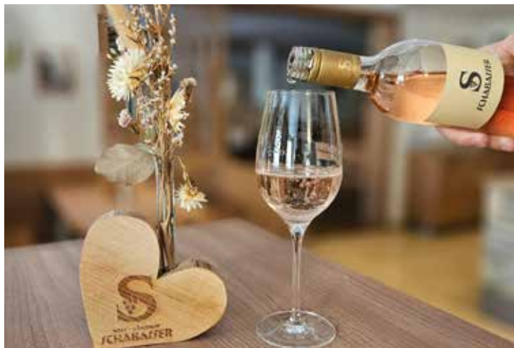
Der dezente Tischschmuck fügt sich harmonisch in das Gesamtbild ein.