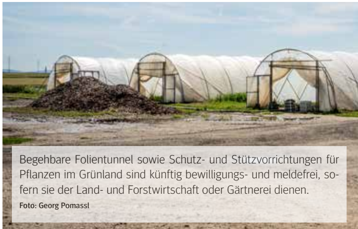
Begehbare Folientunnel sowie Schutz- und Stützvorrichtungen für Pflanzen im Grünland sind künftig bewilligungs- und meldefrei, sofern sie der Land- und Forstwirtschaft oder Gärtnerei dienen.