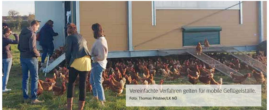
Vereinfachte Verfahren gelten für mobile Geflügelställe.

Die neue Niederösterreichische Bauordnung bringt für landwirtschaftliche Betriebe ab März 2026 zahlreiche Erleichterungen. Die Details zu den Neuerungen erfahren Sie im Beitrag.