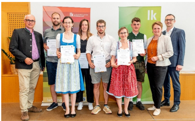
(nicht am Foto: David Zwickelstorfer)

Dazu dürfen wir recht herzlich gratulieren.